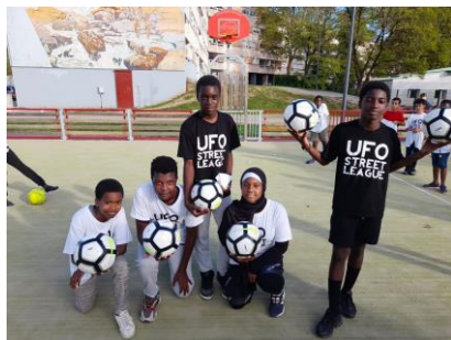
UFOSTREET maison commune 2022