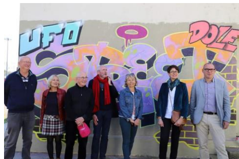
UFSOTREET à Dole en 2021

Une quinzaine de femmes participent à ce projet sur le département.