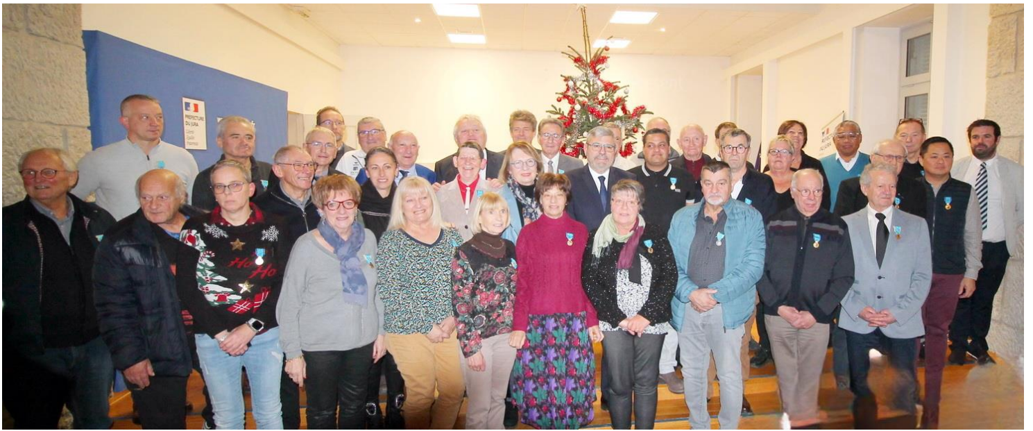
Les récipiendaires lors de la cérémonie en Préfecture